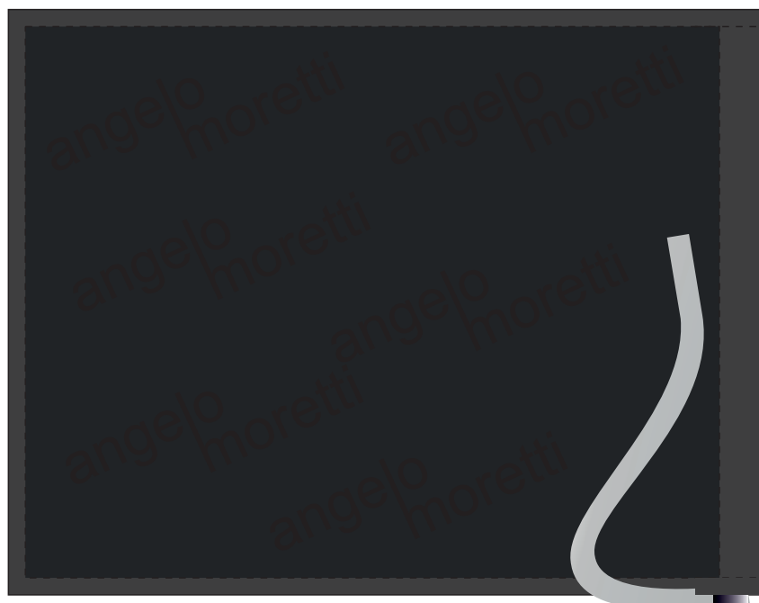
Внутренняя сторона слева